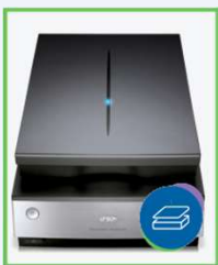
1) Einlesen mit Scanner

Ein kalibrierter Scanner erfasst Blätter bis zum Format DIN A4 mit einer Auflösung von 2400 dpi oder höher. Das Modul analysiert das Druckbild hinsichtlich fehlender Punkte und Ungleichmäßigkeiten, hervorgerufen durch Schwankungen der Druckpunktfäche und -intensität. Die Ergebnisse werden strukturiert aufbereitet und können direkt als Tabelle oder Bild exportiert und weiterverarbeitet werden.