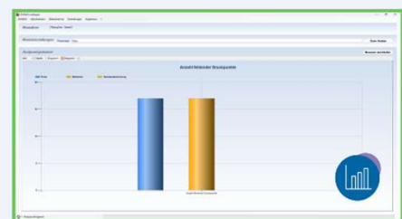
3) Ausgabe Diagramm